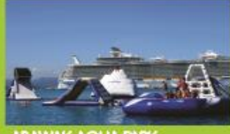
ARAWAK AQUA PARK