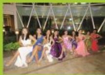
NOCHE DE GALA