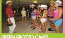
GREEN GROTTTO CAVES