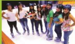
DIVERSIÓN AL MÁXIMO