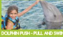
DOLPHIN PUSH - PULL AND SWIM