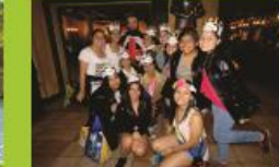
MEDIEVALS TIME RESTAURANT