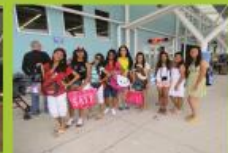
COMPRAS EN EL BARCO