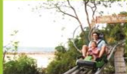
DRAGON'S TAIL COASTER SINGLE RIDE