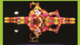
CIRCLE DU SOLEIL

Nos trasladaremos al Aeropuerto Internacional de Orlando donde tomaremos nuestro vuelo de regreso a casa, con la satisfacción de haber cumplido nuestra ilusión y disfrutado del mejor viaje de nuestras vidas, llenas de experiencias inolvidables y gratos recuerdos que de seguro compartiremos con nuestros seres queridos.