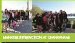
MANATEE INTERACTION AT CHANKANAAB