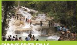
DUNN'S RIVER FALLS